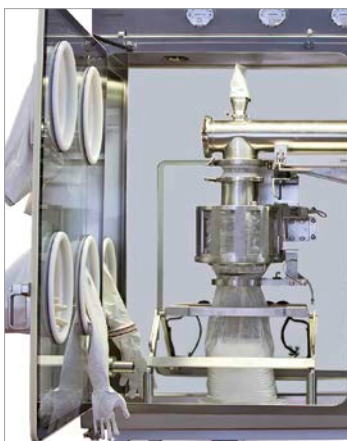
Dosier- und Abfüllsystem mit Endlos-Folie und Trenn-Schweiss-Gerät im Isolator

OEB – Occupational Exposure Band OEL – Occupational Exposure Limit P&T – pharmakologische & toxische Wirkung