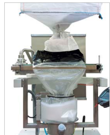
SMART Containment – Peelbare Containment-Folie exklusiv bei Novindustria