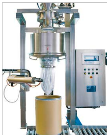
Endlos-Folien-Befüllanlage mit Vibro-Dos®, pneumatischer Clipper, Waage und Rollenbahn