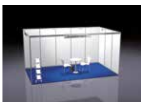
ALL-IN GEEIGNET FÜR 15 – 23 m 2