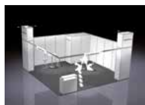
ALL-IN PLUS GEEIGNET FÜR 24 – 49 m 2