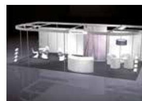
ALL-IN PREMIUM AB 50 m 2

Sie haben Innovationen, Komponenten und Lösungen aus den Bereichen industrielle Pumpen, Armaturen und Prozesse?