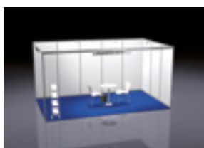
ALL-IN GEEIGNET FÜR 15 – 23 m 2