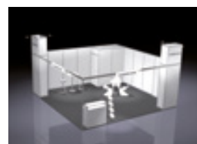
ALL-IN PLUS GEEIGNET FÜR 24 – 49 m 2