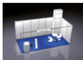
ALL-IN UPGRADE GEEIGNET FÜR 15 – 23 m 2