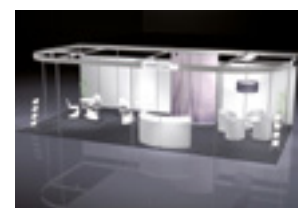
ALL-IN PREMIUM AB 50 m 2

Sie haben Produkte, Software, technische Lösungen und Dienstleistungen für die industrielle Instandhaltung?