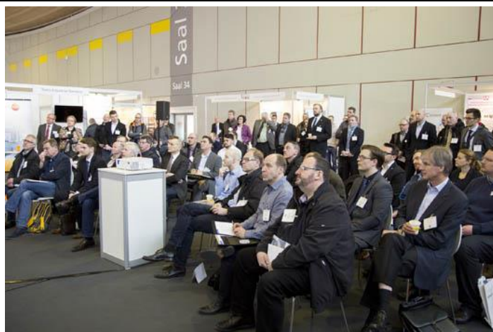
Bild Nr. 04-01 EF_Vortrag.jpg

Das Konzept des Messeveranstalters Easyfairs mit einer Mischung aus Fachausstellern, Science-Center, Austauschmöglichkeiten und Guided Tours kommt sehr gut an.