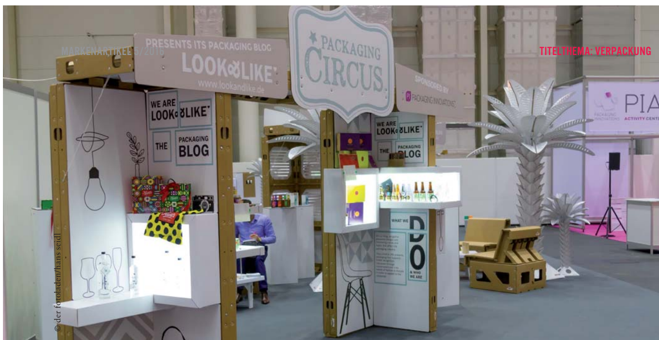
Auf der Packaging Innovations vom 23. bis 24. Juni in Hamburg geht es u.a. darum, wie die Digitalisierung die Verpackungswelt künftig beeinflussen wird

eine Verpackung aber natürlich auch die bestmögliche Verkaufswirkung erreichen und den Konsumenten zum Kauf verführen. Eine gut gestaltete Verpackung kann einen emotionalen Mehrwert schaffen.