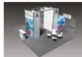
ALL-IN PREMIUM AB 50 m 2