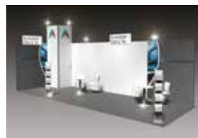
ALL-IN PLUS GEEIGNET FÜR 24 – 49 m 2