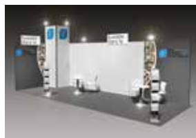
ALL-IN PLUS GEEIGNET FÜR 24 – 49 m 2