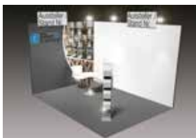
ALL-IN GEEIGNET FÜR 15 – 23 m 2