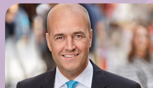
Fredrik Reinfeldt, f.d. statsminister