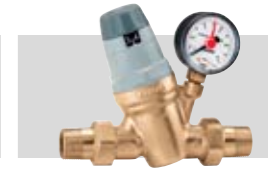
Art. 535051 | ¾"