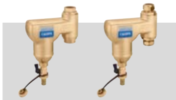
Art. 546902 | 22 Ø Art. 546905 | ¾" Art. 546906 | 1"