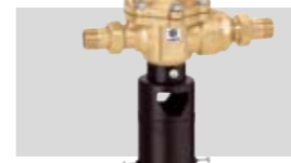
Art. 574050 | ¾"