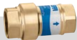
Série 127 | ½" & ¾"