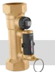
Série 132 | De ½" à 2"