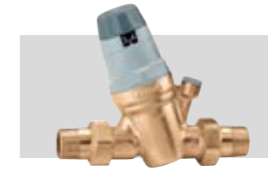
Art. 535050 | ¾"