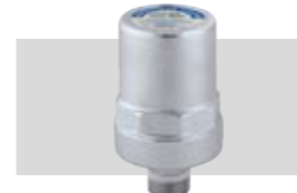
Art. 525040 KWA | ½"