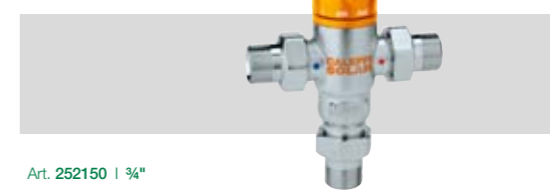
Art. 252150 | ¾"