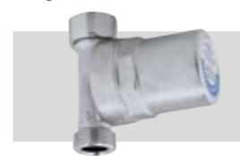
Art. 525150 KWA | ¾"