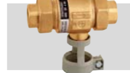
Art. 573401 | ½" Art. 573501 | ¾"