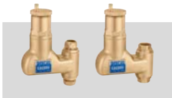
Art. 551902 | 22 Ø Art. 551905 | ¾" Art. 551906 | 1"