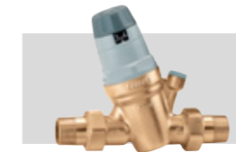
Art. 535050 | 3/4"