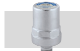
Art. 525040 KWA | 1/2"