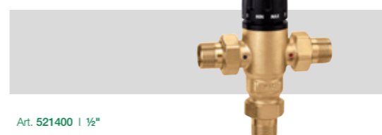
Art. 521400 | 1/2"