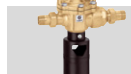
Art. 574050 | 3/4"