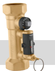
Serie 132 | Van 1/2" tot 2"