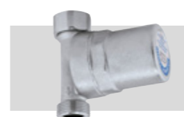
Art. 525150 KWA | 3/4"