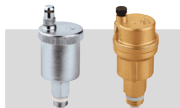
Art. 502730 | 22 Ø Art. 502132 | 3/4" Art. 502142 | 1"