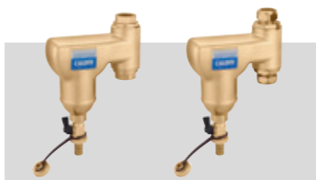
Art. 546902 | 22 Ø Art. 546905 | 3/4" Art. 546906 | 1"