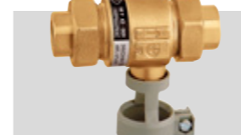
Art. 573401 | 1/2" Art. 573501 | 3/4"