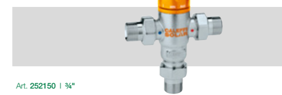
Art. 252150 | 3/4"