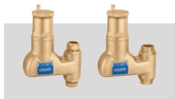
Art. 551902 | 22 Ø Art. 551905 | 3/4" Art. 551906 | 1"