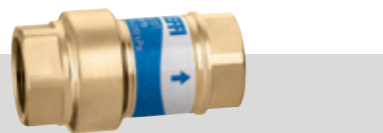
Serie 127 | 1/2" & 3/4"