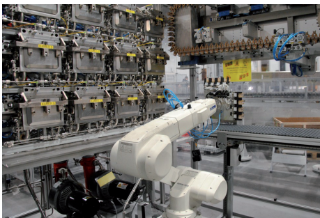
In-lijn helium lekdetectiesysteem met een capaciteit van 2000 producten per uur.