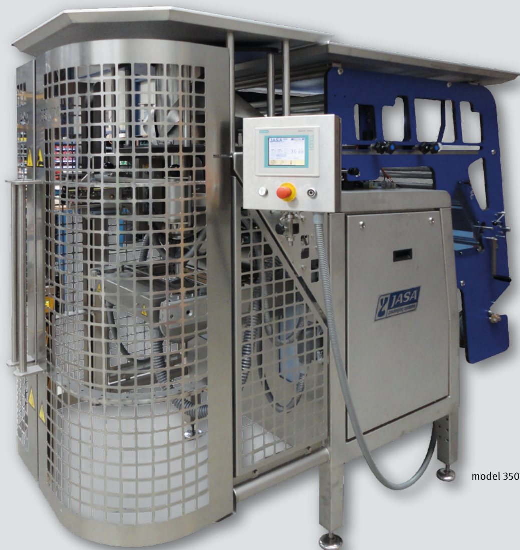
model 350 CM

Verticale vorm-, vul- en sluitmachine Continuous film motion