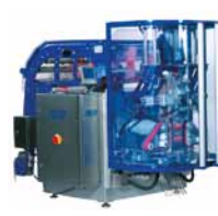
Jasa Quatro Pack