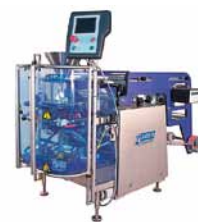
Jasa Tri Pack