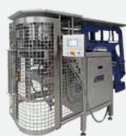
Jasa 350 CM