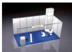
ALL-IN UPGRADE GEEIGNET FÜR 15 – 23 m 2