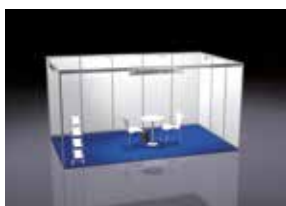
ALL-IN GEEIGNET FÜR 15 – 23 m 2