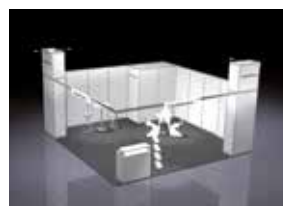
ALL-IN PLUS GEEIGNET FÜR 24 – 49 m 2